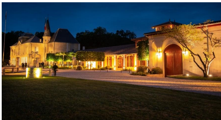
Château Lynch-Moussas - Pauillac | Fête de la Fleur - Jeudi 16 mai 2019

Vinexpo Bordeaux ayant lieu maintenant à Paris, la Fête de la Fleur a donné naissance à deux sœurs, le diner de Gala à Paris et la Fête du Bontemps. Le diner de Gala à Paris pour accompagner Wine Paris et la Fête du Bontemps pour conserver un rendez-vous bordelais incontournable à l'occasion de la venue des professionnels pour la semaine des primeurs.